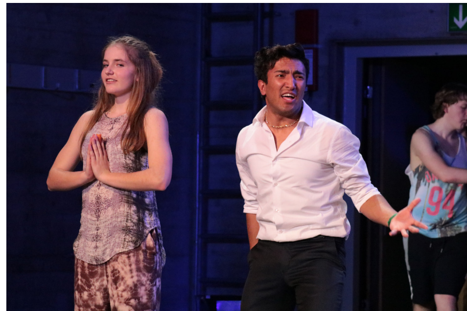
CAS Project AG Theater, 2019