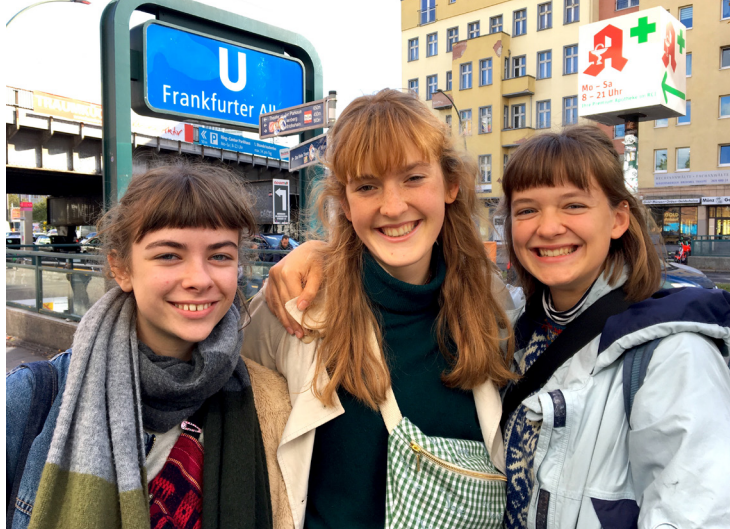
Arbeitswoche in Berlin, 2019