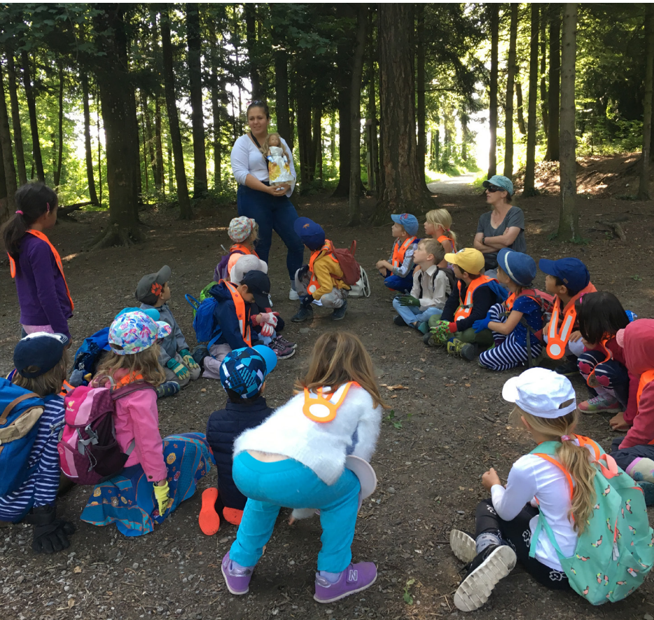
CAS Project im Kindergarten, 2019

Die IB-Ausbildung legt grossen Wert auf Ausgewogenheit, deshalb sind die sogenannten "core subjects", die Herzstücke, eine wichtige Ergänzung. Nebst den akademischen Fähigkeiten, werden mit CAS und ToK auch Sozialkompetenz und das philosophische Denken geschult. Mit dem Extended Essay müssen die Schülerinnen und Schüler eine erste akademische Arbeit verfassen.